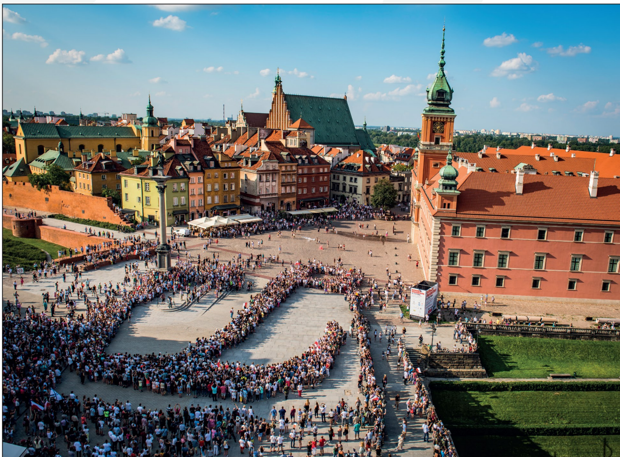
Godzina „W” na Placu Zamkowym w Warszawie 1 sierpnia 2018 roku