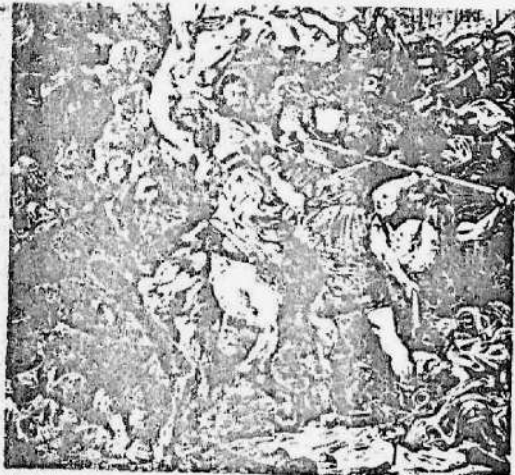
FRAGMENT Z OBRAZU GRUNWALD JANA MATEJKI

W ROKU 1410 dnia 15 lipca połączone wojska polskie, litewskie, smoleńskie, krakowskie, czeskie i morawskie, silne swoją odwagą stoczyły na polach Grunwaldu zwycięski bój z śmiertelnym wrogiem Szwabów i krzyżakami.